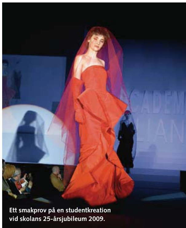
Ett smakprov på en studentkreation vid skolans 25-årsjubileum 2009.